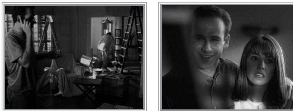
Fig. 3. Gestualidad ante la adversidad, Movistar (Telefónica, 1997)

En él nos encontramos a una pareja leyendo el periódico en un bar al mismo tiempo que llaman por teléfono. A continuación observan una casa, la suya, que se acaban de comprar. En ese momento la felicidad de su expresión facial se torna en sorpresa desagradable dado el estado de abandono que presenta la casa.