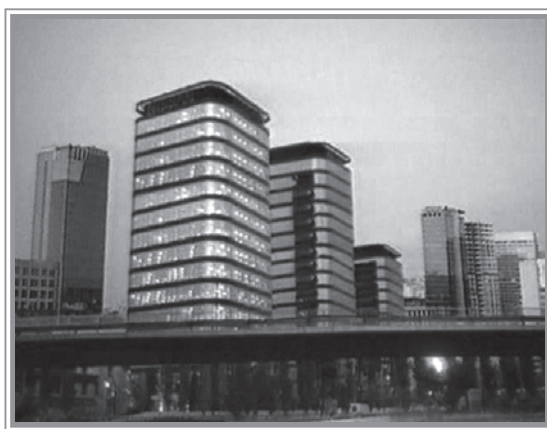
Fig.1. Imagen espacial de la ciudad, Movistar (Telefónica, 1996)

Efectivamente, nos encontramos ante un espacio utópico estético en el que lo tecnológico vertebral el ambiente idealizándolo hacia el progreso y ocultando el espacio de la miseria y los suburbios sociales.