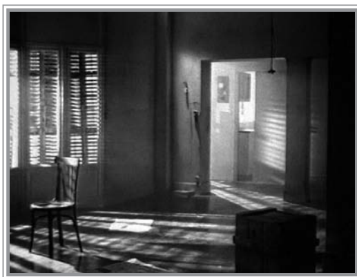
Fig. 4. Reconocimiento de la identidad del signo. Movistar (Telefónica, 1997)

Como vemos, la verticalidad, lo circular, y la luz forman parte del imaginario identificativo de la marca Movistar para el usuario-consumidor.