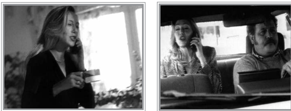
Fig. 2. Unión signo-usuario. Movistar (Telefónica, 1996)

¿Qué función tiene Movistar? ¿Cómo aparece representado? Mientras que todo fluye rapidísimo en la vida cotidiana laboral, la posesión del objeto permanece siempre en contacto con el sujeto, siendo la única constante del discurso.