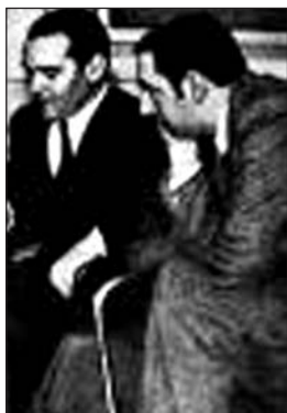
García Lorca y Neruda en Buenos Aires, 1933.