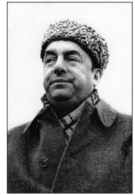
En Moscú, 1949.

Avatares de una poesía sin pureza. La racionalidad en la obra de Neruda