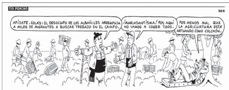
FIGURA 2. Cuando se esta agudizando la crisis económica, que en Alicante, afecta directamente a la construcción, se aprecia un trasvase de mano de obra de este sector a la hortofruticultura. Así, hasta la prensa diaria en clave de humor lo recogía. Fuente: Periódico La Verdad , edición del 17-6-2008. Autorizada su reproducción por e-mail. Fecha 7-7-2008.