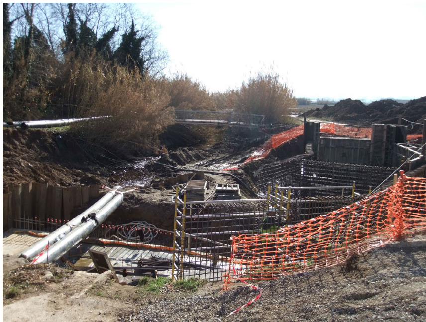
Autor: D. Pavón (24-I-2012)

Figura 2. Construcción de la nueva conducción de agua para los riegos del bajo Ter, a la derecha de la acequia histórica de Gualta-Pals, en el punto de derivación de sus caudales respecto al propio río Ter (arbolado en la izquierda de la imagen). Mientras las obras se ejecutan, unos tubos provisionales permiten que el agua continúe discurriendo a través de la acequia histórica a cielo abierto.